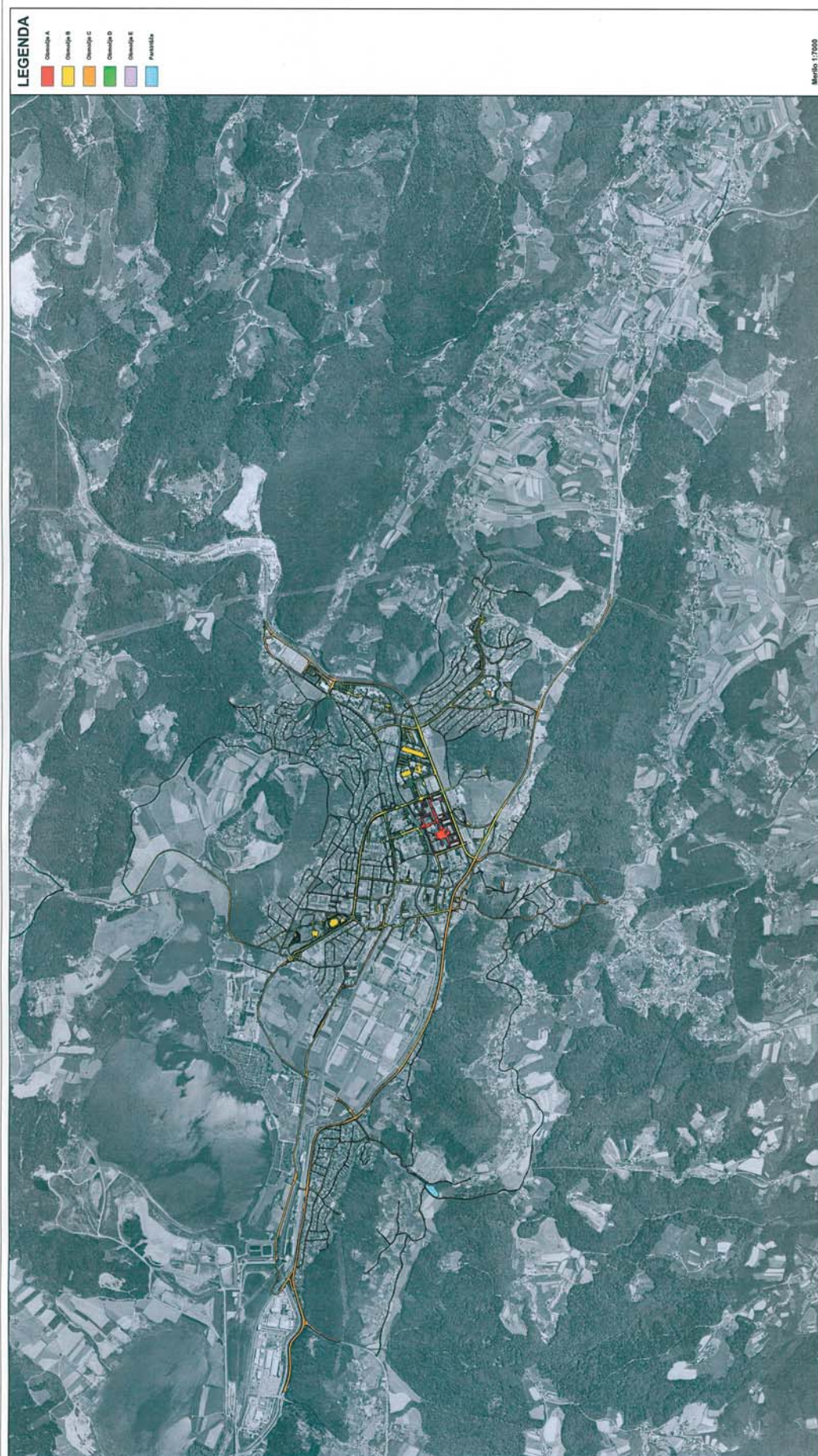
Priloga II: Pregledna karta utrjenih javnih in drugih površin