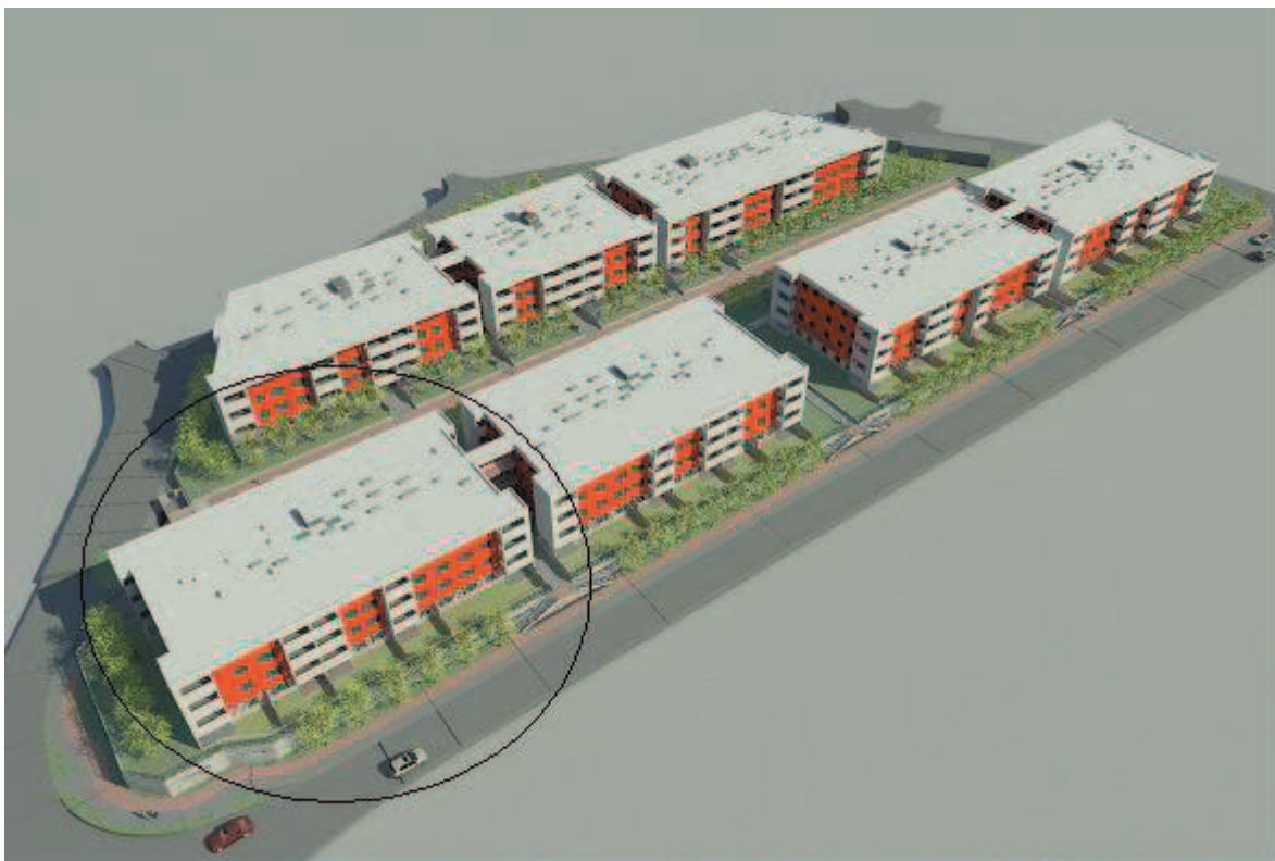
Grafična priloga k točki 10, priloga 2 - preglednica B: Načrt pridobivanja nepremičnega premoženjem občine za leto 2010 zaporedna št. 12 - 31