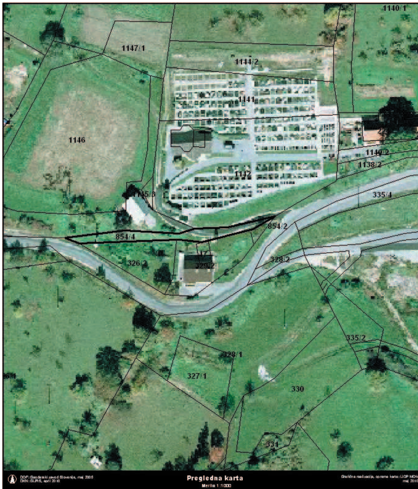
Grafična priloga k točki 10, priloga 1 - preglednica A: Načrt razpolaganja z nepremičnim premoženjem občine v letu 2010 zaporedna št. 24