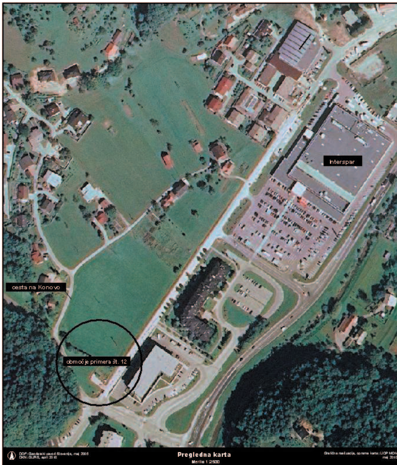
Grafična priloga k točki 10, priloga 2 - preglednica B: Načrt pridobivanja nepremičnega premoženjem občine za leto 2010 zaporedna št. 12 - 31