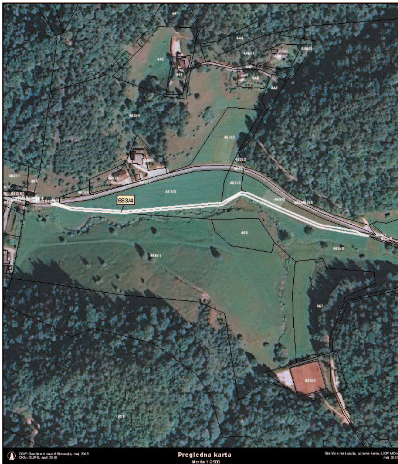
Grafična priloga k točki 10, priloga 1 - preglednica A: Načrt razpolaganja z nepremičnim premoženjem občine v letu 2010 zaporedna št. 20