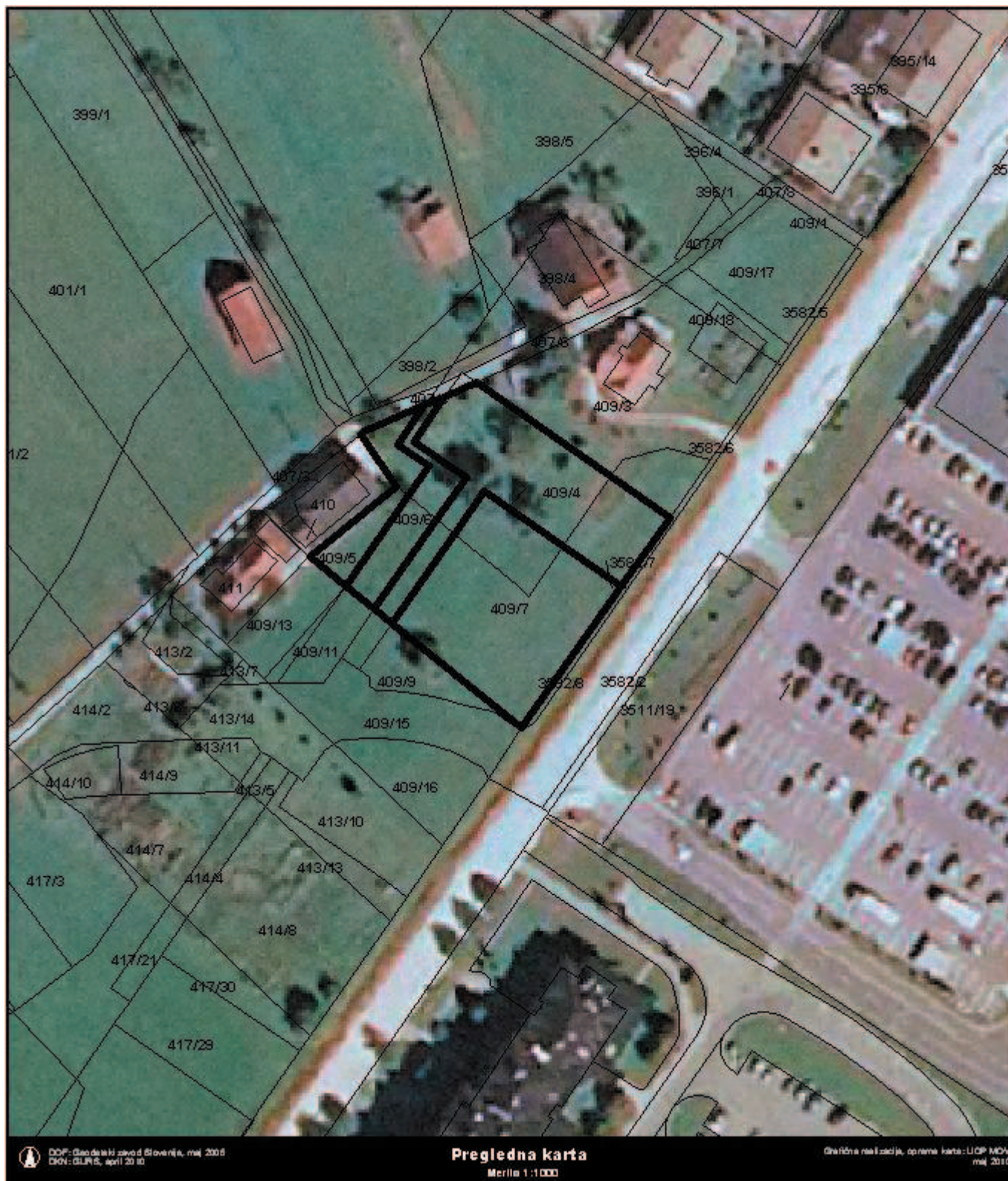
Grafična priloga k točki 10, priloga 2 - preglednica B: Načrt pridobivanja nepremičnega premoženja občine za leto 2010 zaporedna št. 7