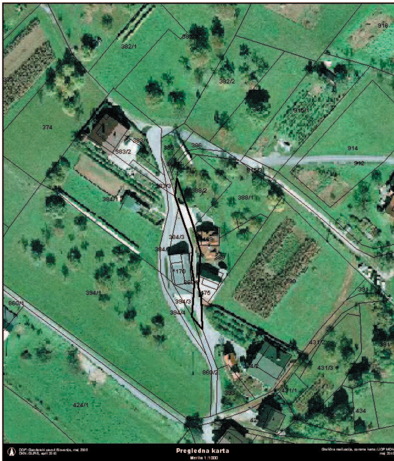
Grafična priloga k točki 10, priloga 1 - preglednica A: Načrt razpolaganja z nepremičnim premoženjem občine v letu 2010 zaporedna št. 23