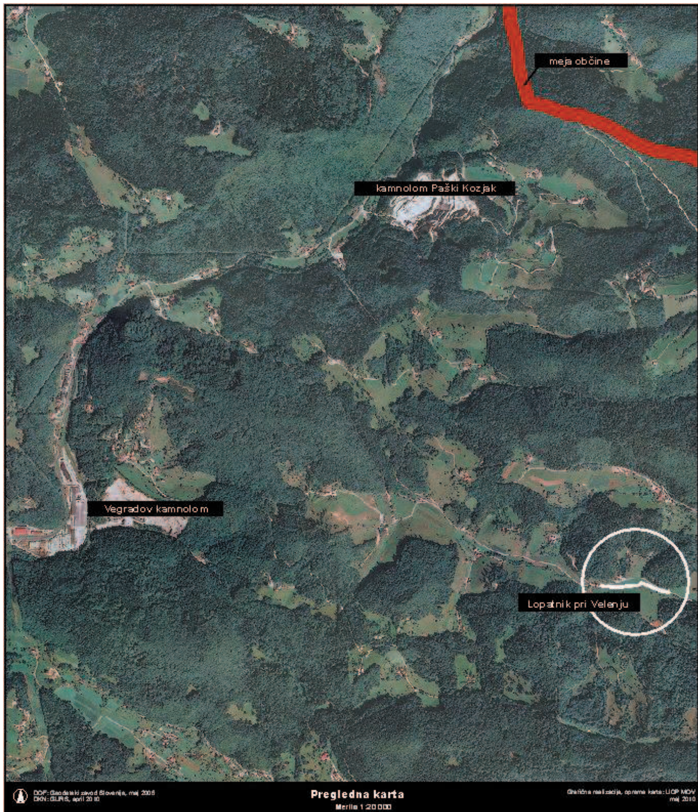
Grafična priloga k točki 10, priloga 1 - preglednica A: Načrt razpolaganja z nepremičnim premoženjem občine v letu 2010 zaporedna št. 20