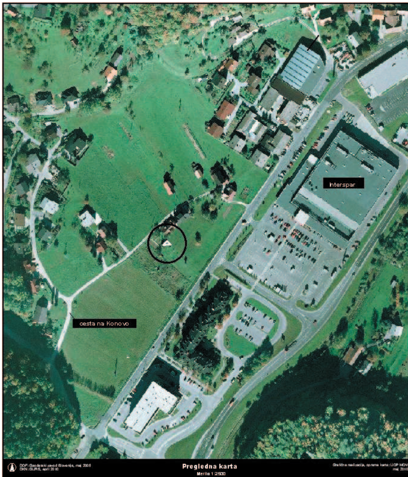
Grafična priloga k točki 10, priloga 1 - preglednica A: Načrt razpolaganja z nepremičnim premoženjem občine v letu 2010 zaporedna št. 22