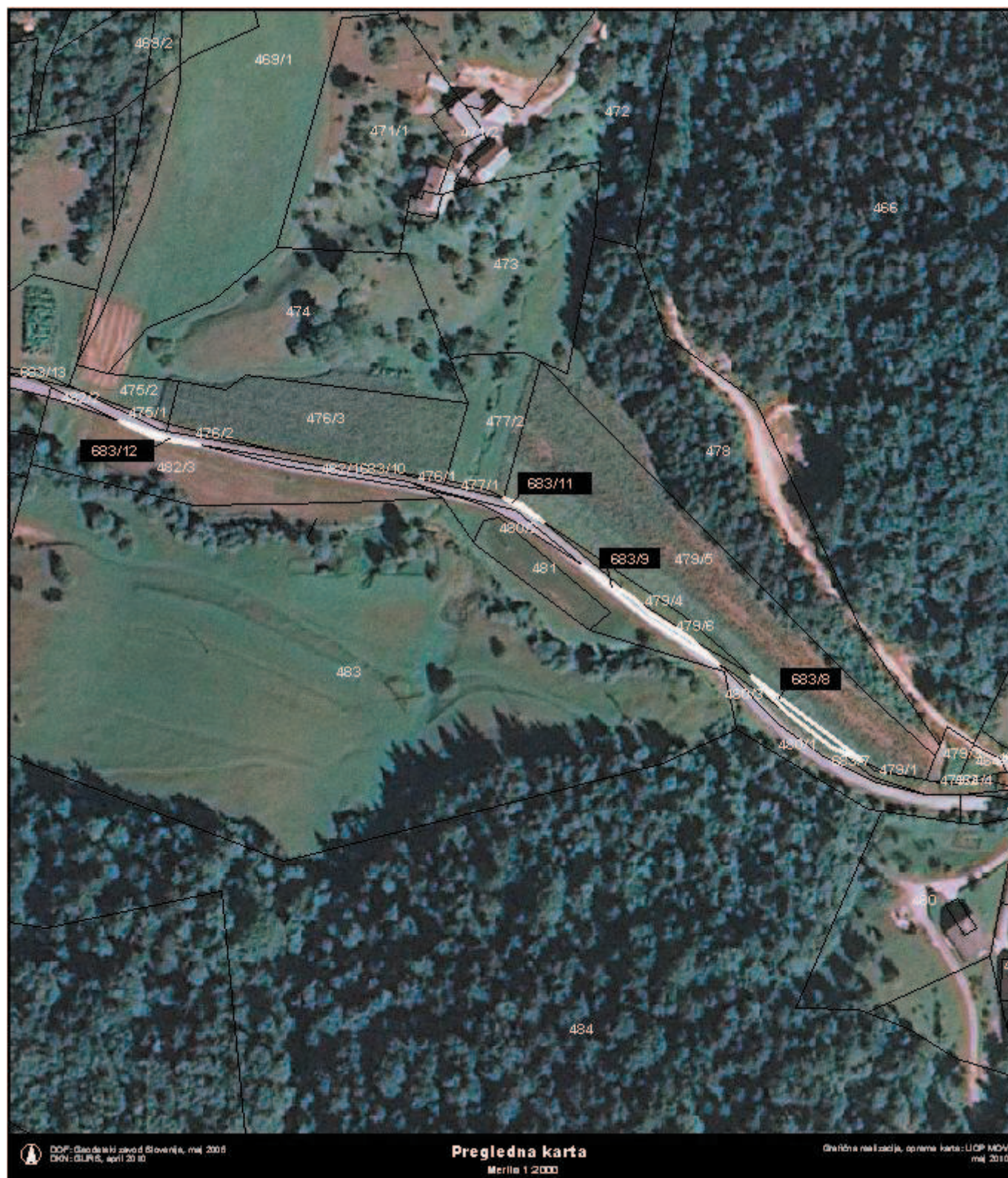
Grafična priloga k točki 10, priloga 1 - preglednica A: Načrt razpolaganja z nepremičnim premoženjem občine v letu 2010 zaporedna št. 21