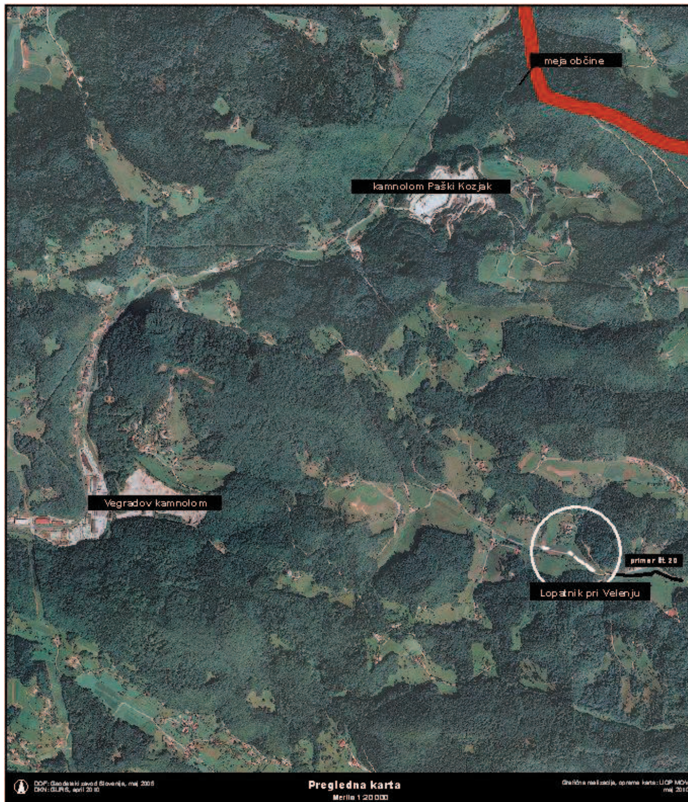
Grafična priloga k točki 10, priloga 1 - preglednica A: Načrt razpolaganja z nepremičnim premoženjem občine v letu 2010 zaporedna št. 21