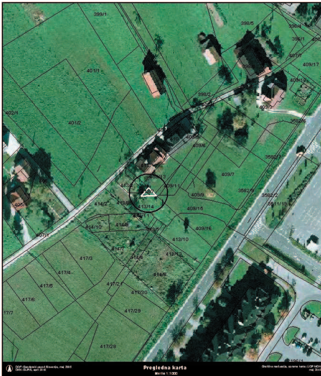
Grafična priloga k točki 10, priloga 1 - preglednica A: Načrt razpolaganja z nepremičnim premoženjem občine v letu 2010 zaporedna št. 22