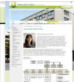
Organizacija Uprave MOV