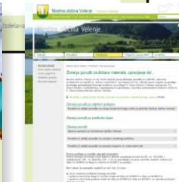
Objava natečajev, razpisov MOV