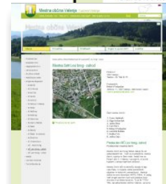
Strani KS in MČ