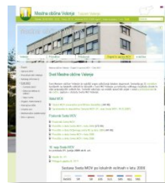
Strani Sveta MOV, glasila ...