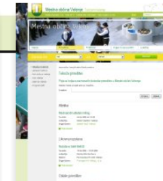
Prireditve v MOV