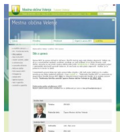
Stiki z upravo